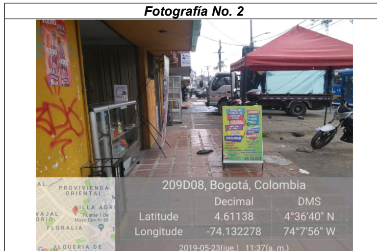
Fotografía del establecimiento de comercio denominado DINAGRAF, elementos no autorizados, instalados en área que constituye espacio público.